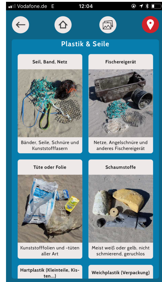
Bestimmungsschlüssel für Plastikmüll in der kostenlosen App BeachExplorer.org