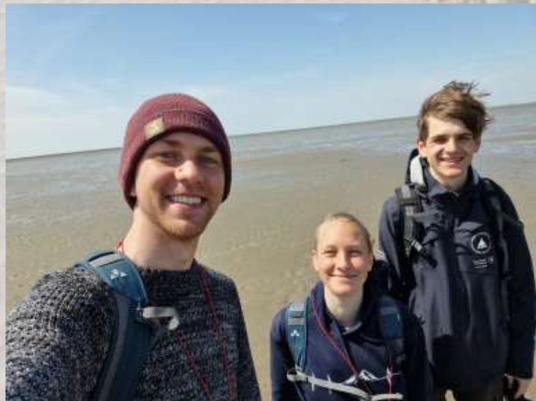
Team Nordstrand bei der Großen Fuhlehörntour (Ich stehe übrigens in einem Loch, so klein bin ich dann doch nicht)

Ich freue mich schon sehr darauf die Tour öfter und mit Besucher:innen machen zu dürfen.