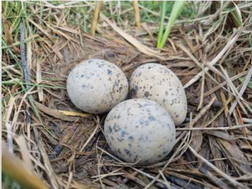
Austernfischernest, entdeckt bei der BruVoKa