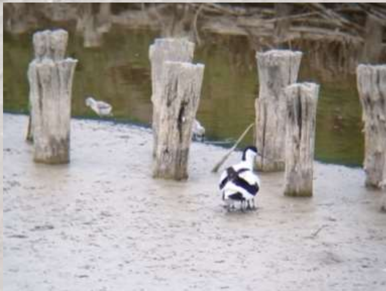
(sechs beiniger) Säbelschnäbler mit Küken

Impressum: Schutzstation Wattenmeer Nordstrand Herrendeich 40 25845 Nordstrand