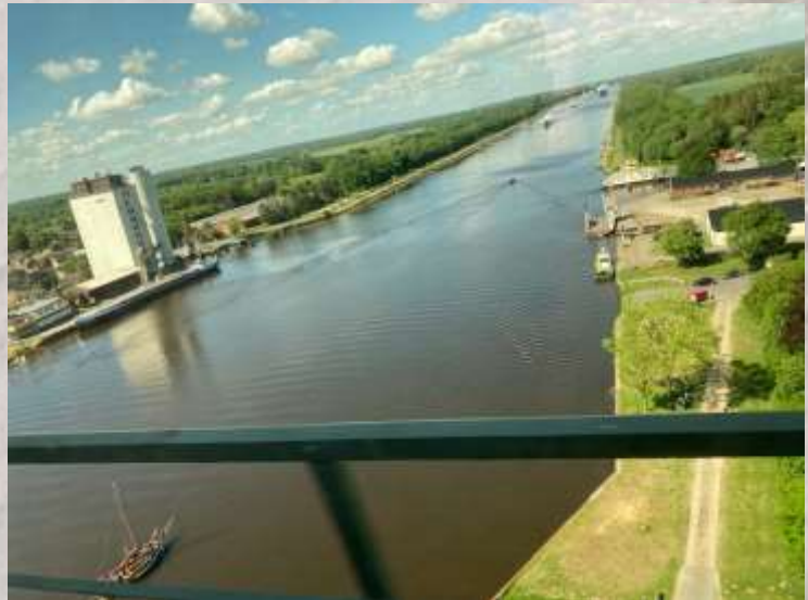
Sonne satt am Nord-Ostsee-Kanal

Völlig richtig, so, wie ihr es von mir gewohnt seid, halte ich euch wieder über das Wetter auf Nordstrand auf dem Laufenden, denn nach dem kühlen, nassen und windigen April war uns ja mit dem Beginn des Mais auch der Beginn des Frühlings angekündigt, auf den wir alle, so schön die rauen Wintermonate auch sein können, schon sehnsüchtig gewartet haben. Da das Erscheinen der Sonne das Schuttenleben natürlich um sehr vieles einfacher und in mancherlei Hinsicht auch schöner macht.