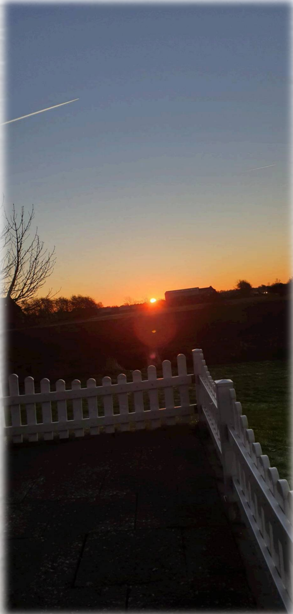
Sonnenaufgang von der Ferienwohnung