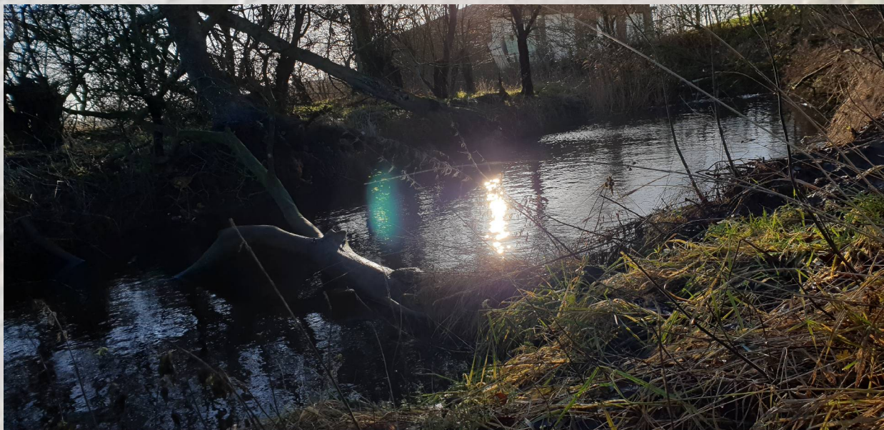
Kleiner Teich bei unserer Ferienwohnung