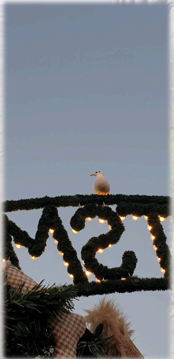
Lachmöve hat Spaß auf dem Weihnachtsmarkt