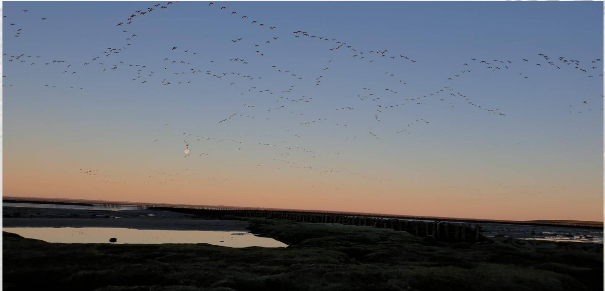
Großer Graugansschwarm in Keilformation